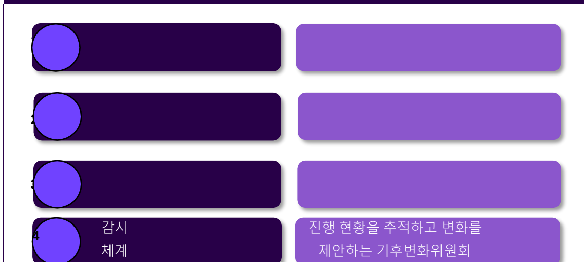
영국 기후변화법의 근간을 이루는 네 가지 핵심 요소

기후변화법의 2050년 목표는 기후 정책에 대해 장기적 방향성을 제시한다.